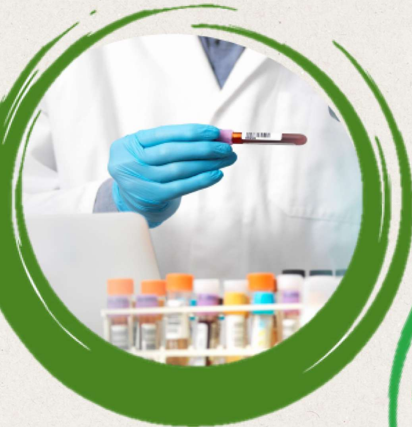
TOMA DE MUESTRAS DE LABORATORIO